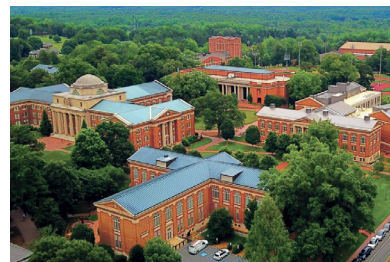
Veduta aerea del college