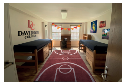
Le camere (tutte doppie)