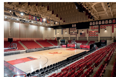
Il mitico palazzetto