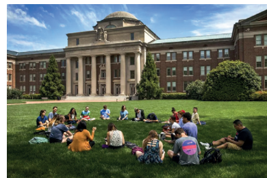
Relax negli spazi verdi del campus